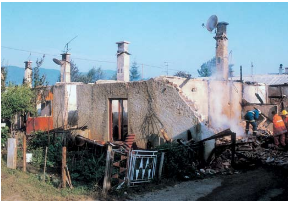
Posledica požara na večstanovanjski stavbi, Šalka vas 102