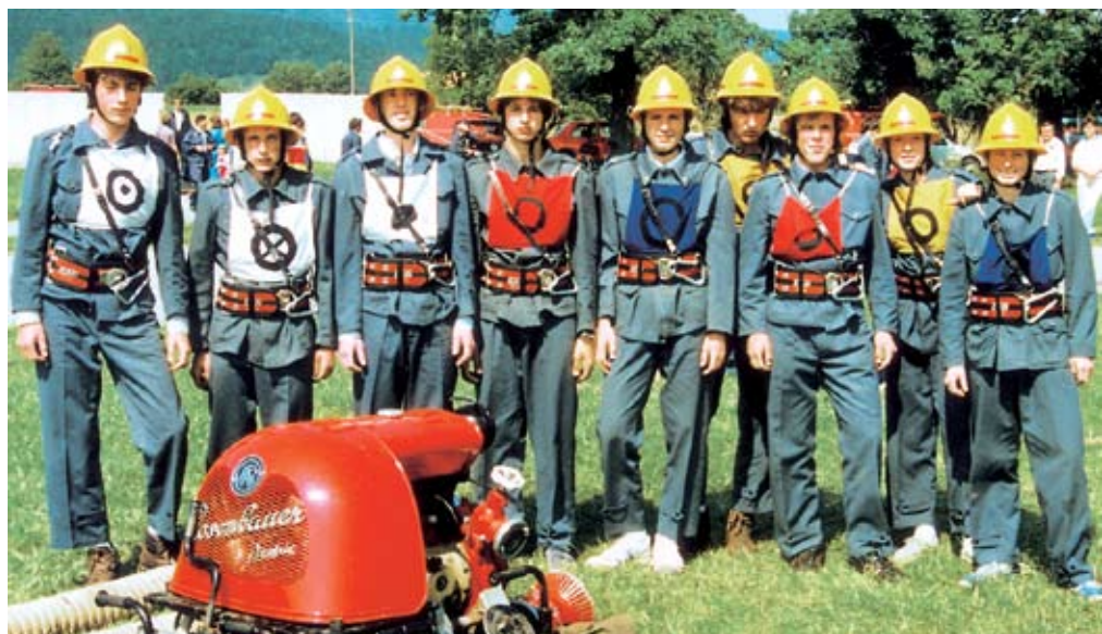
Mladinska desetina konec 80-ih let pejšnjega stoletja

Operativno delo je vedno obsegalo veliko različnih gasilskih vaj kot priprava na tekmovanja ali kot priprava za intervencije. Vaje se izvaja v suhi izvedbi in z vodo, večinoma so načrtovane,