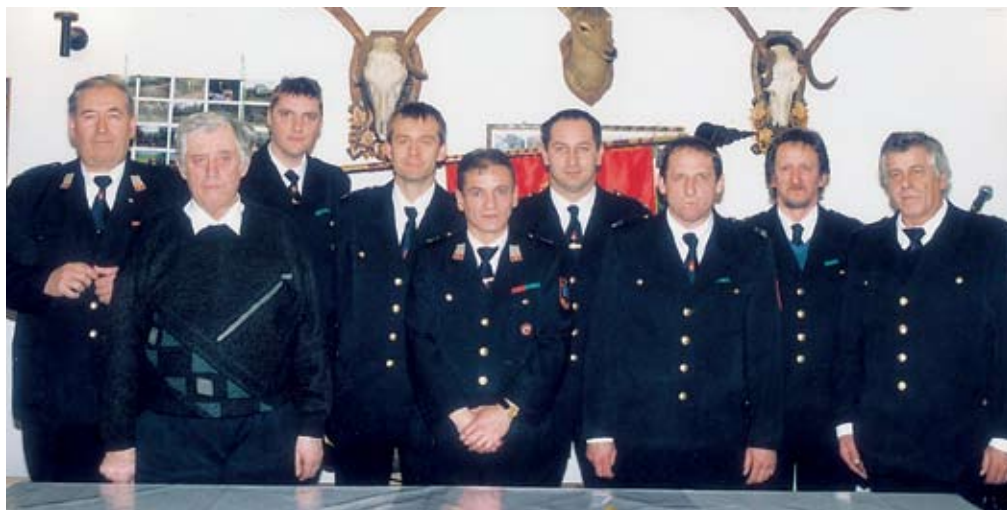
Poveljstvo društva v mandatnem obdobju 1998–2002

vizuelni pregledi hidrantov ter črpanje vodnjakov. Preventivno delo se izvaja vsaj od leta 1969, verjetno pa že od usta-