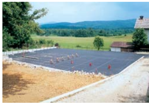
Gasilski poligon – velika pridobitev za operativno članstvo