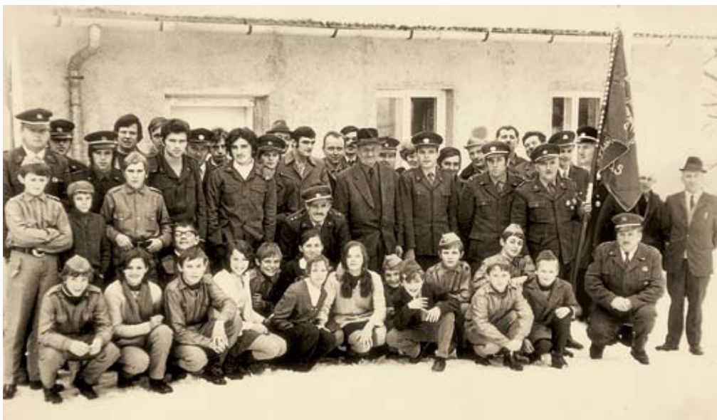
Članstvo društva leta 1972

višji gasilski častnik I.st., je že drugi mandat poveljnik regije Ljubljana II, je aktualni pod-