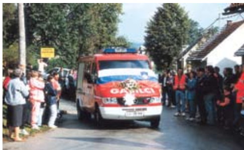
Manjše gasilsko vozilo z vodo Mercedes Benz