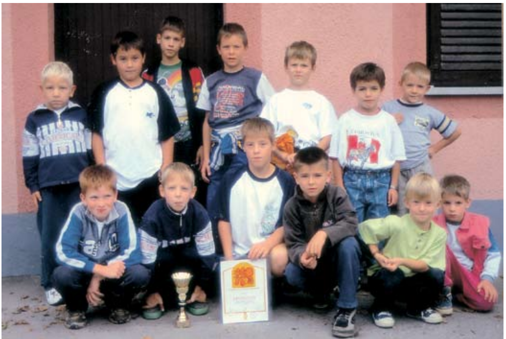
Pionirska desetina leta 2000