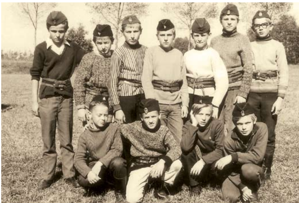
Pionirska desetina okoli leta 1970