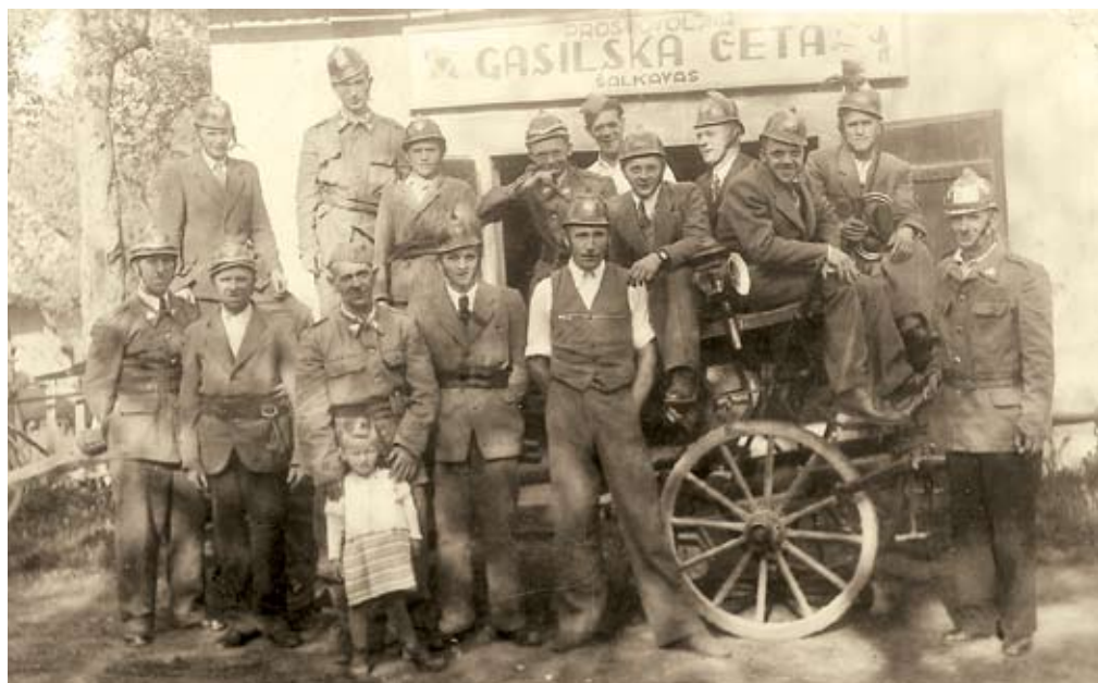
Operativni člani društva okoli leta 1950

območju vasi Šalka vas, Željne, Cvišlerji, Onek, Mačkovec in del mesta Kočevje ter za naravno okolje v krajevni skupnosti Šalka vas v občini Kočevje. Po