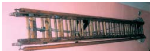
Raztezna lestev iz GD Rudnik-Itas