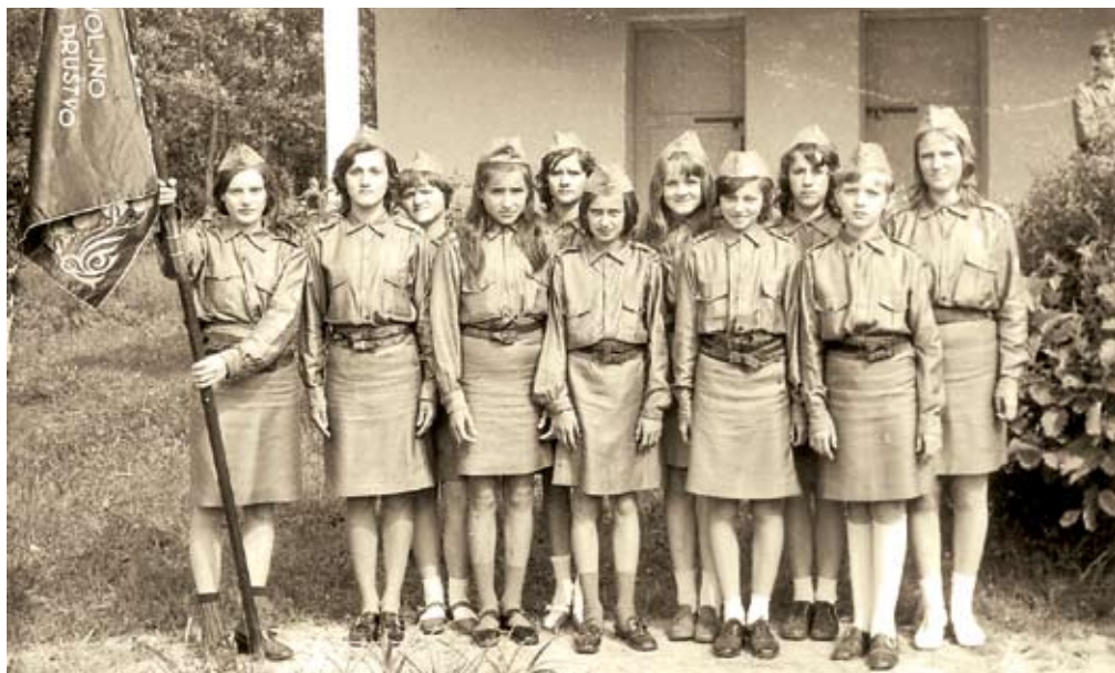
Desetina pionirk leta 1972