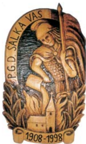
Spominski grb ob 90-letnici društva, avtor V. Kobola