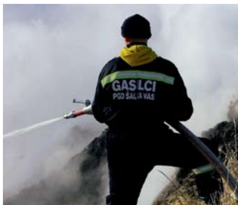
Gašenje požara v naravnem okolju

Člani PGD Šalka vas so pomagali gasiti požare v naravnem okolju na Krasu v letu 2003 in dvakrat v letu 2006.