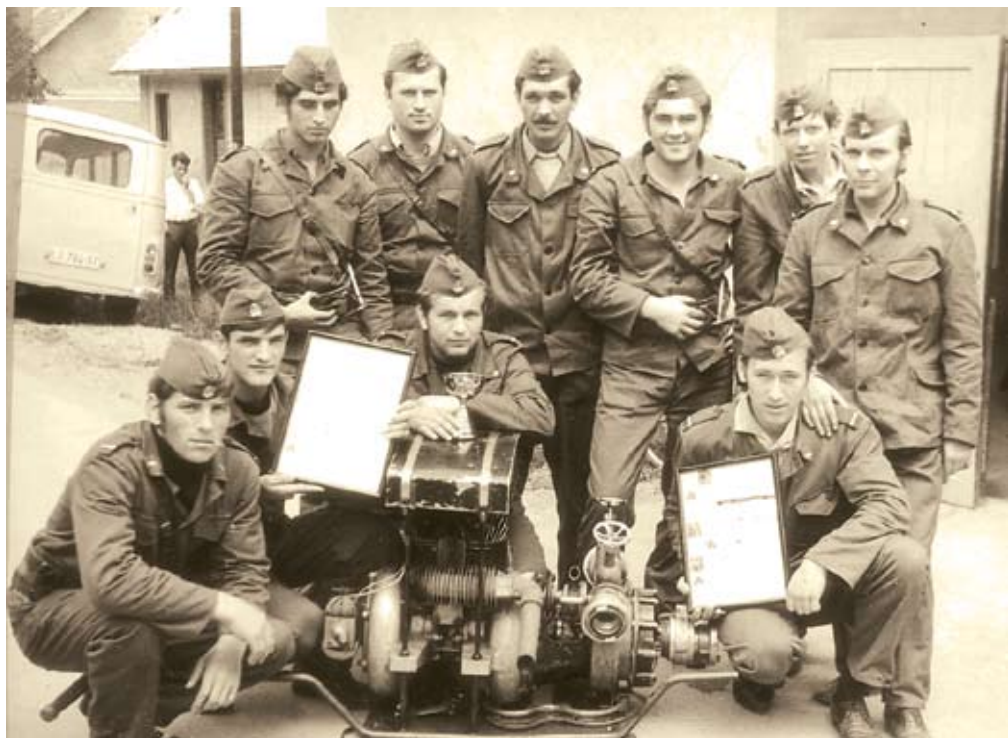
Operativna desetina okoli leta 1970

Operativne enote sodelujejo pri gašenju večjih požarov v občini Kočevje (Komunala, Aviotex.).