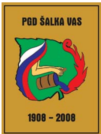
Novi logotip PGD Šalka vas