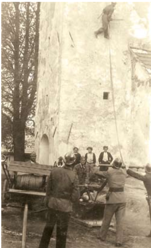
Operativna vaja članov v obdobju takoj po drugi svetovni vojni