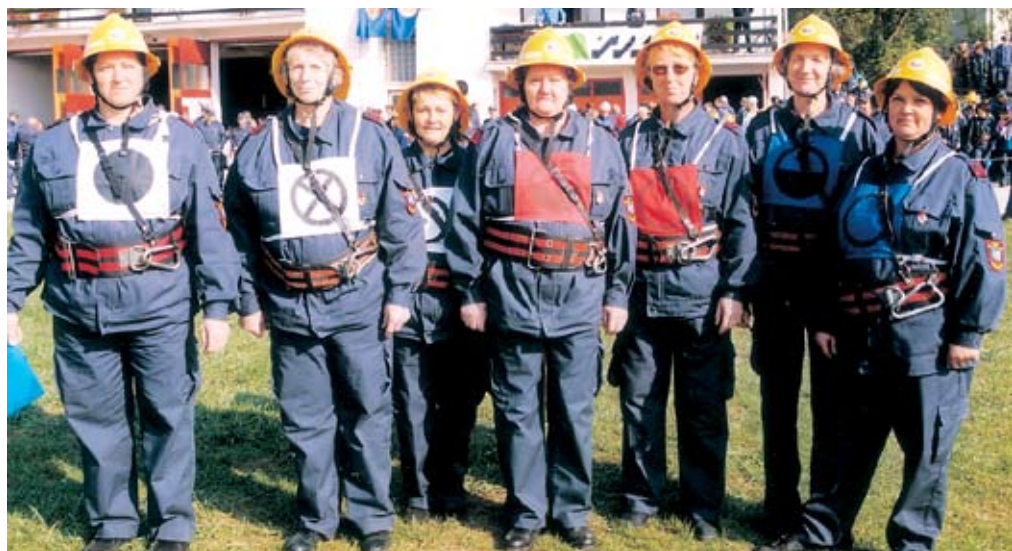
Desetina veterank dosega vidne rezultate na gasilskih tekmovanjih

novitve dalje. Občasno so se izdelovale operativne karte. V decembru gasilci krajanom zaželimo srečno novo leto s koledarji, kar je praksa vsaj že od leta 1979.