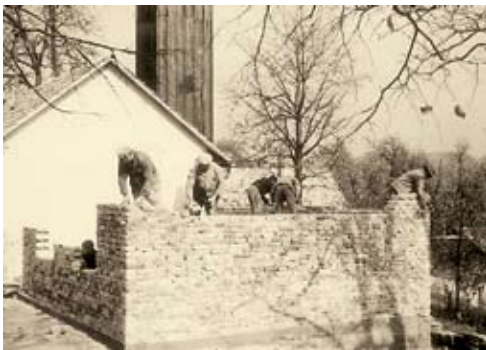
Dograditev doma leta 1971