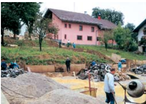
Dograjen gasilski dom po letu 1990, gradnja gasilskega poligona