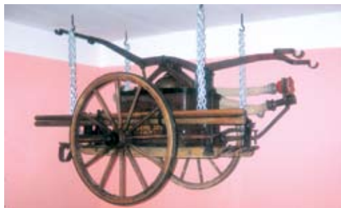
Ročna črpalka iz enote Željne