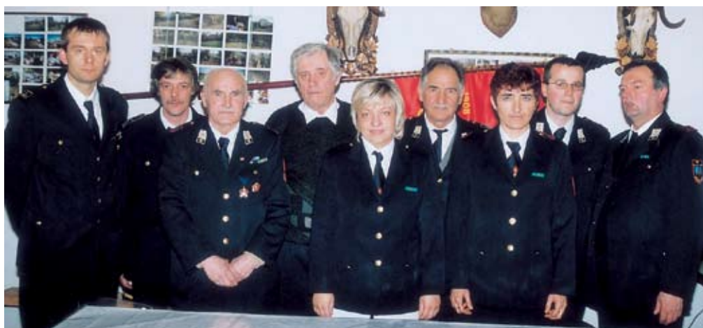
Upravni odbor društva v mandatnem obdobju 1998-2002