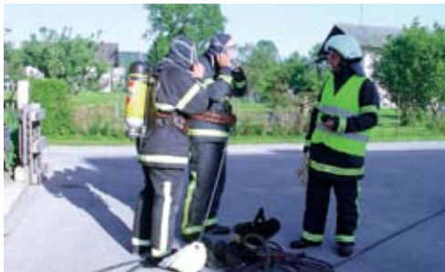
Operativni gasilci pred akcijo

Največ gasilskih intervencij je bilo v zadnjih 30 letih na si-