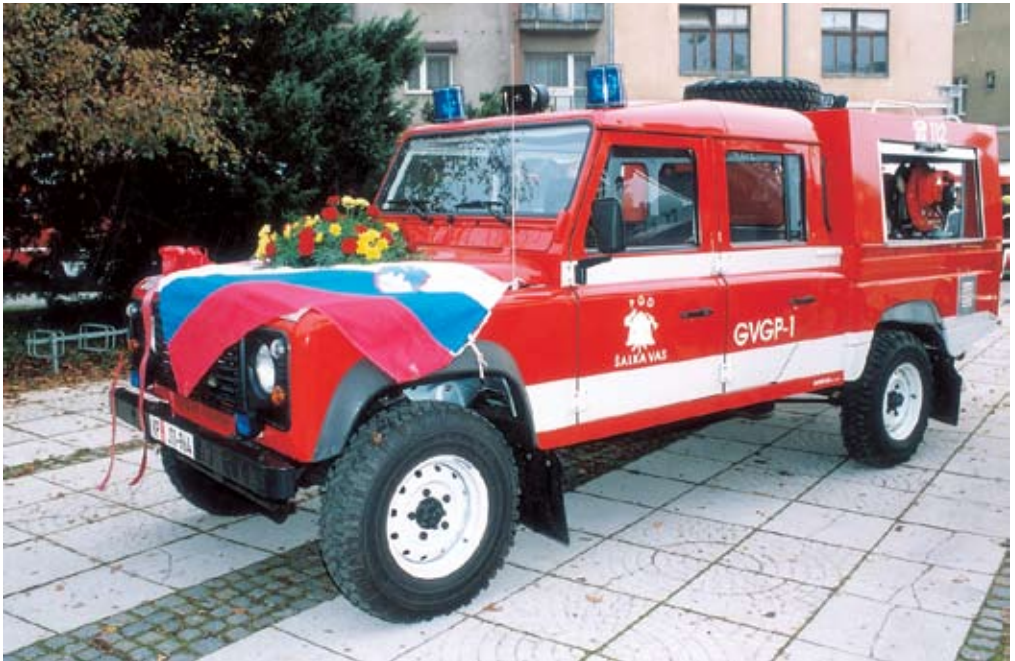
Najnovjše vozilo - manjše gasilsko vozilo za gozdne požare Landrover Defender iz leta 2005