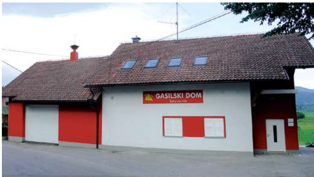
Gasilski dom PGD Šalka vas, prenovljen v letih 2007–2008