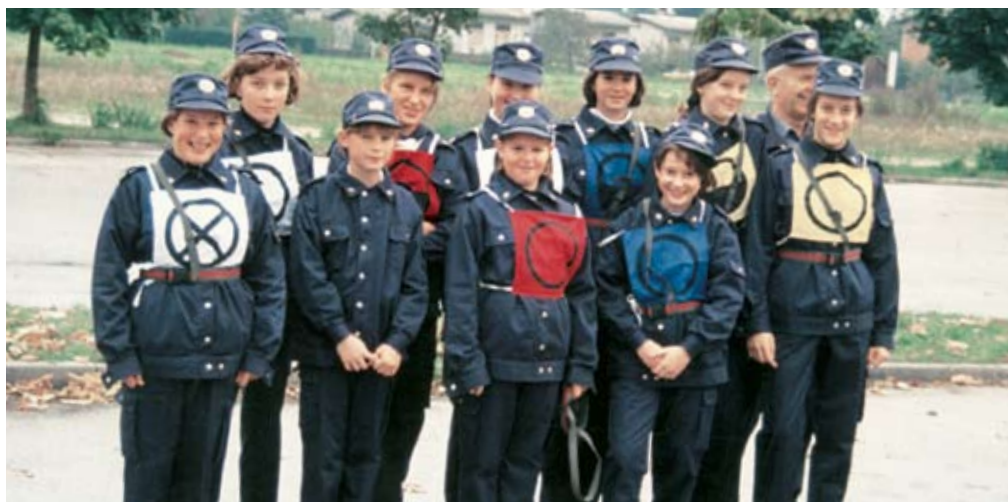
Desetina mladink, 3. mesto na državnem gasilskem tekmovanju, leta 1995

Danes ima društvo sodobno gasilsko opremo, tipizirani vozili in osebno zaščitno opremo ter usposobljene operativne enote, ki imajo v zadnjih letih med 20 in 25 intervencij letno.