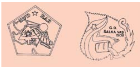
Logotip DVD Rab in PGD Šalka vas ob pobratenju leta 1989

Leta 1975 smo gasilci že začeli s sodelovanjem na proslavah prostovoljnih gasilskih društev izven naše gasilske zveze (Delnice, Šentvid pri Stični). Danes je sodelovanje s soslednjimi društvi zelo dobro razvito, saj se udeležujemo svečanosti in tekmovanj v GZ Kočevje, v soslednjih GZ (Stranska vas pri Semiču) in v Republiki Hrvaški (Plešče, Delnice).