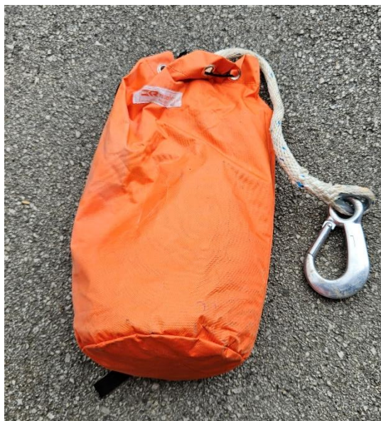
Slika 10: Reševalna vrv s karabinom v torbici