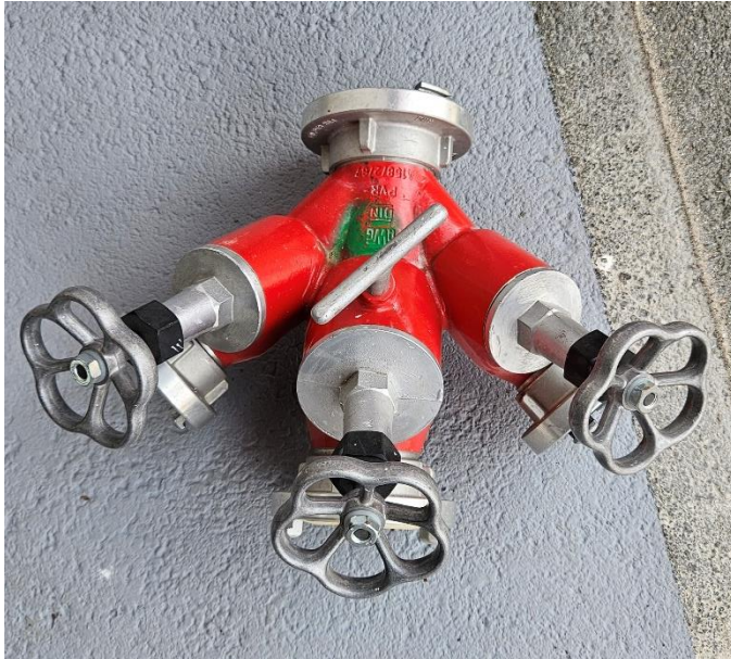
Slika 12: Trojak B/CBC