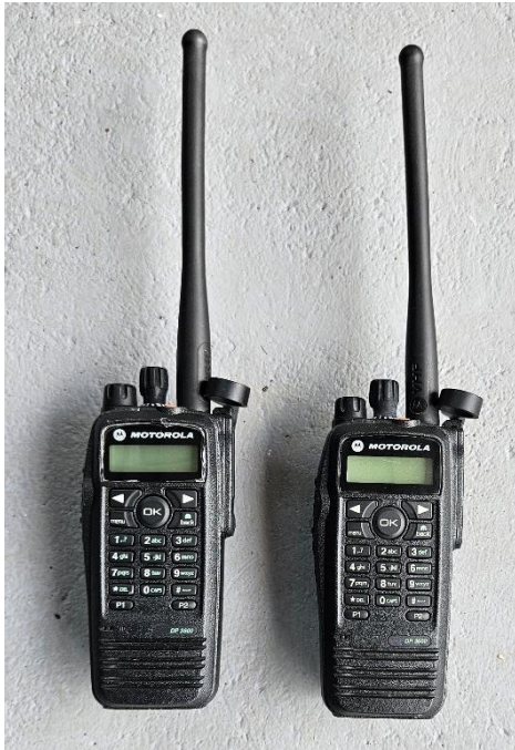
Slika 14: Radijska postaja Motorola DP 3600