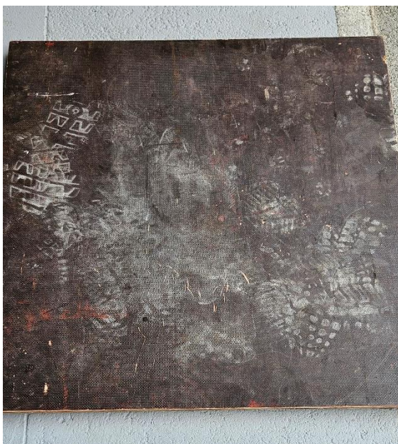
Slika 13: Plošča za odlaganje zvite cevi