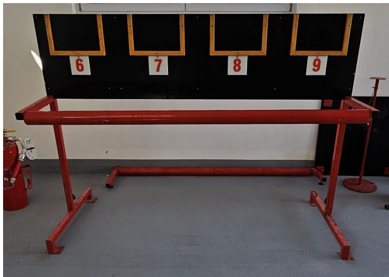
Slika 7: Stojalo za vezanje vozlov