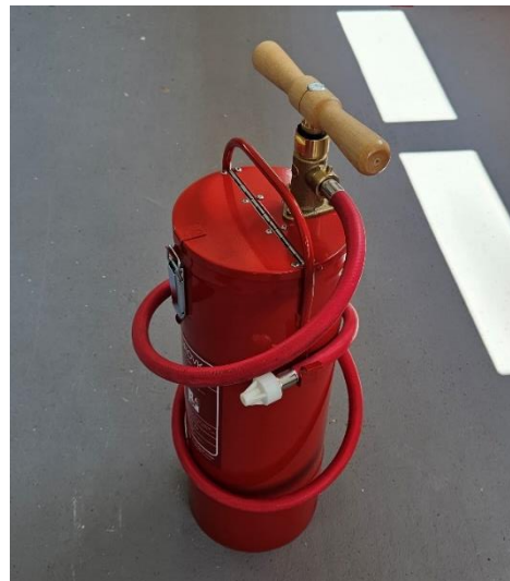
Slika 2: Vedrovka