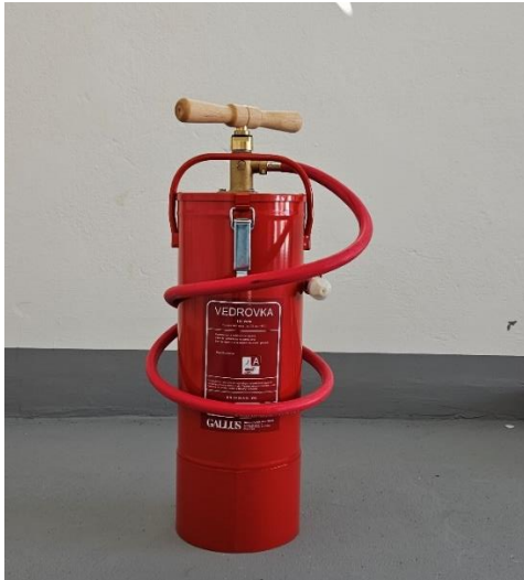
Slika 1: Vedrovka