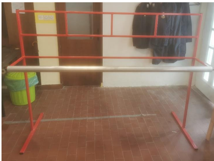
Slika 8: Stojalo za navezavo orodij