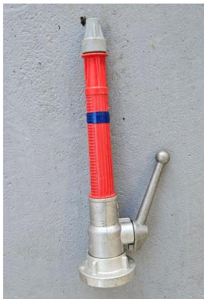
Slika 9: Navaden C-ročnik z zasunom